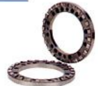
2枚式カービックカップリング